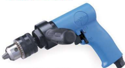
OP-101GA 1/2" Handle exhaust 下排氣