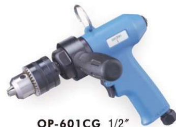
OP-601CG 1/2" Handle exhaust 下排氣