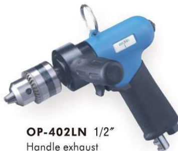
OP-402LN 1/2" Handle exhaust 下排氣