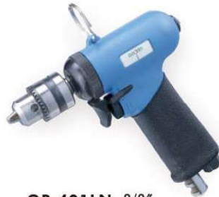
OP-401LN 3/8" Handle exhaust 下排氣