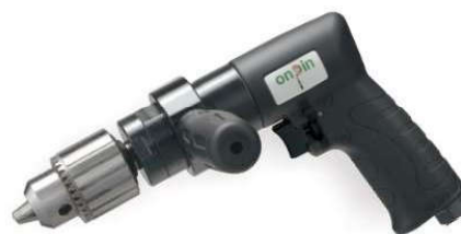
OP-D8410 1/2" Composite handle OP-D8406 1/2" Handle exhaust 複合材料把手 下排氣