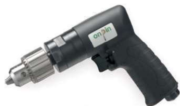
OP-D84140 3/8" Composite handle OP-D8448 3/8" Handle exhaust OP-D8432 3/8" 複合材料把手 OP-D8425 3/8" 下排氣