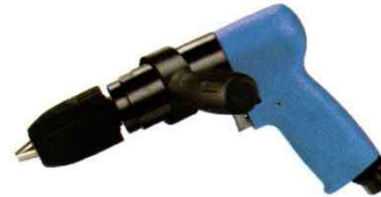
OP-D135106 Handle exhaust 下排氣