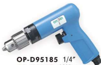
OP-D95185 1/4" OP-D9560 1/4" OP-D9540 1/4" OP-D9531 3/8" OP-D9525 1/2" Handle exhaust 下排氣