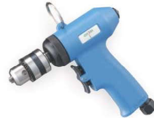
OP-601C 3/8" Handle exhaust 下排氣