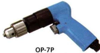
OP-7P Handle exhaust 下排氣