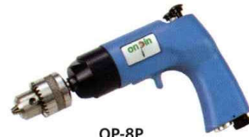
OP-8P Handle exhaust 下排氣