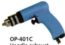
OP-401C Handle exhaust 下排氣