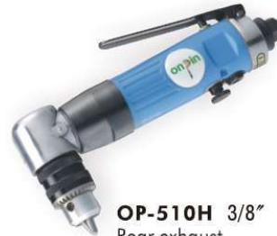
OP-510H 3/8" Rear exhaust 後排氣