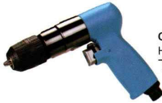
OP-D105117 Handle exhaust 下排氣