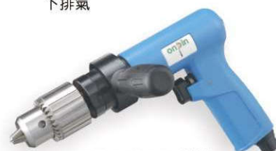
OP-D9519 3/8" OP-D9512 1/2" OP-D9506 1/2" Handle exhaust 下排氣