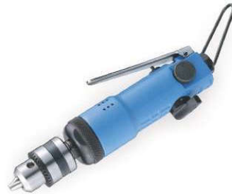
OP-102 3/8" Side exhaust 側排氣