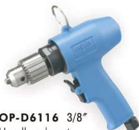
OP-D6116 3/8" Handle exhaust 下排氣