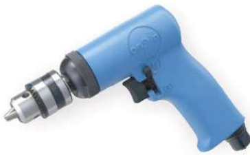
OP-101 3/8" Handle exhaust 下排氣