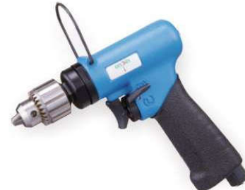
OP-D5128 1/4" Handle exhaust 下排氣